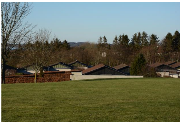
Sorte gavle breder sig nogle steder i landskabet.