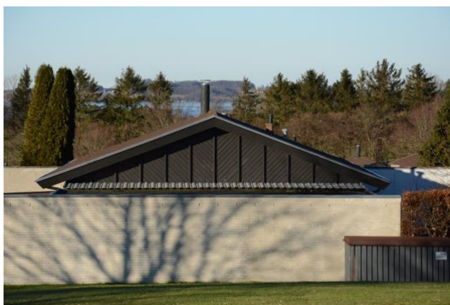
En sort gavl virker ikke så lidt gumpetung og kedelig