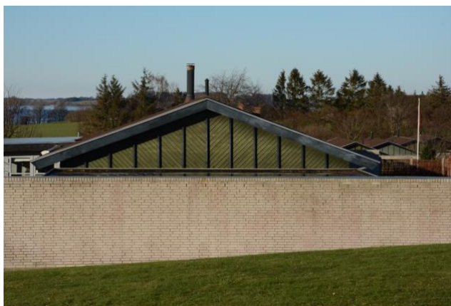
Grøn gavl m. sorte sprosser lever i harmoni med landskabet.