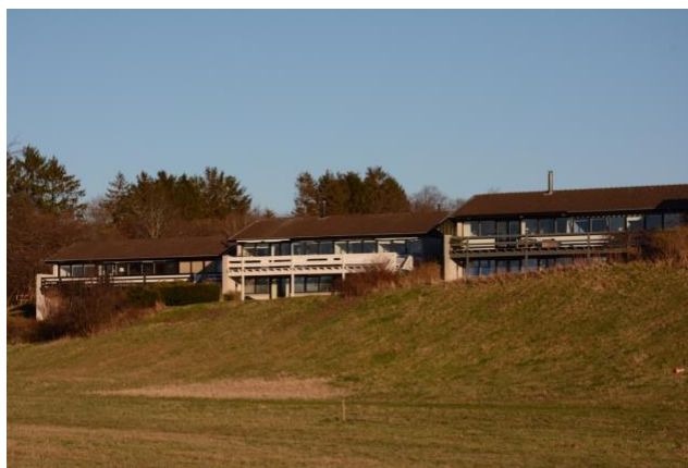
Hvide rækværker langs Søengen adskiller sig påfaldende fra husenes oprindelige diskrete harmoniske farveholdning.